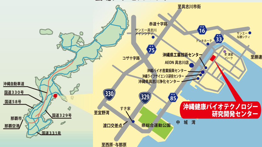
会場アクセスマップ

バイオ産業活性化支援共同体事務局 (一般社団法人トロピカルテクノプラス内) 〒904-2234 沖縄県うるま市字州崎 12-75 沖縄健康バイオテクノロジー研究開発センター内 E-mail: asbi@okinawa-tlo.com TEL: 098-937-2130 FAX: 098-934-8436