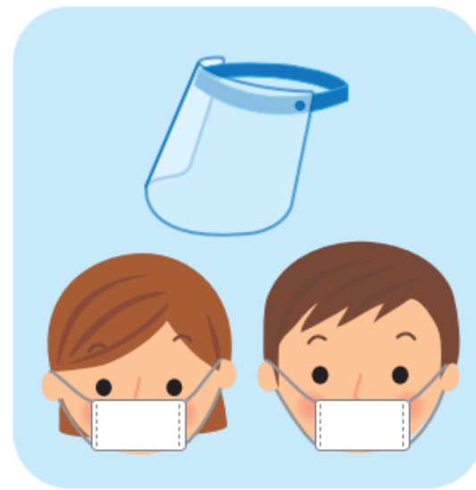
◎マスク着用※大声禁止