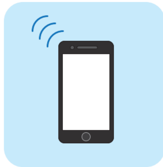
◎(推奨)接触確認アプリの インストール