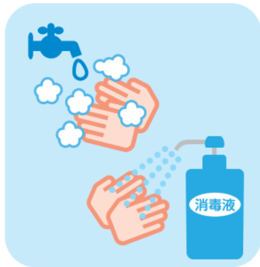
◎手洗い・うがい・ 手指消毒の徹底