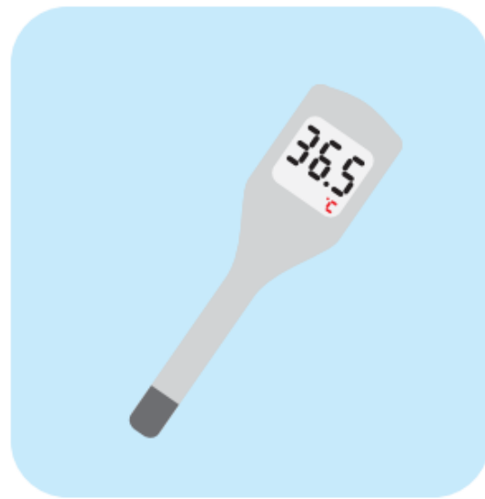
◎会場入り口の検温