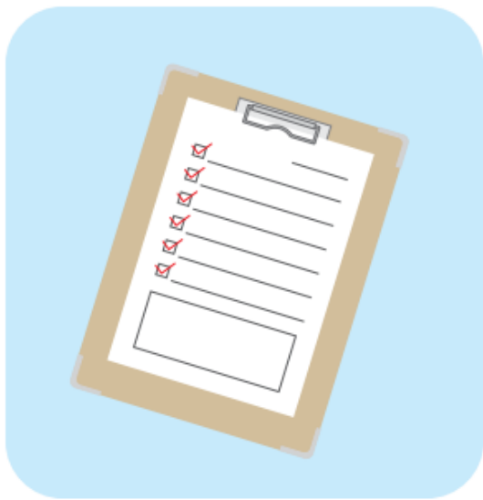
◎健康状態申告書の提出