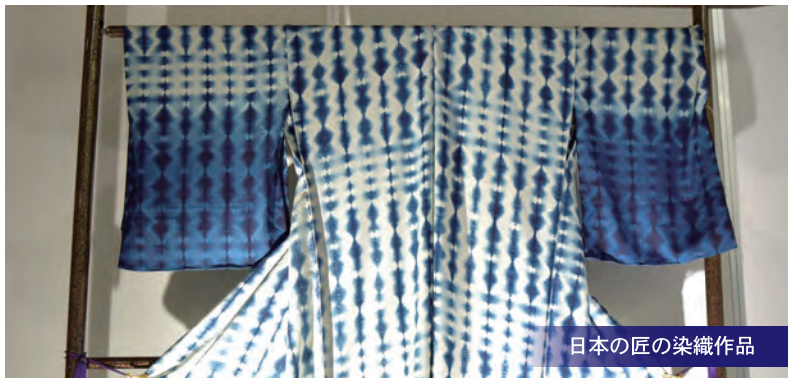
日本の匠の染織作品