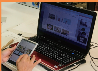
発信力を高める、実践的な演習