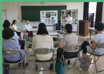
ブランド力を高めるワークショップ