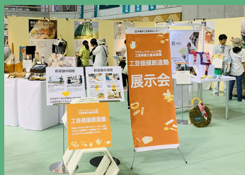
集客と展示会のノウハウを学ぶ