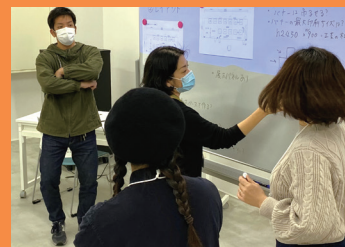
売上をのばすための計画作り